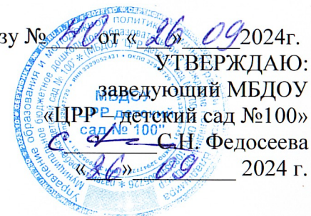
ГРАФИК ПРОВЕДЕНИЯ ЗАНЯТИЙ в порядке оказания дополнительных образовательных услуг МБДОУ «Центр развития ребенка – детский сад №100»